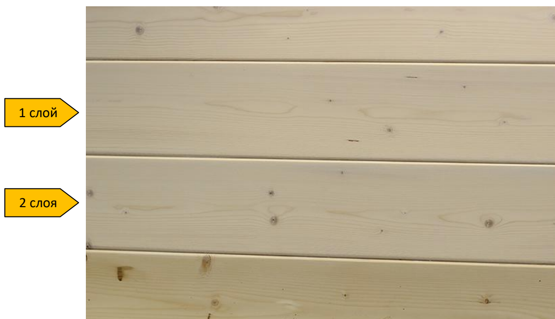
образцы с однослойным и двухслойным нанесением Terra Wax-Oil

Adler Terra Wax-Oil (арт. 703600020002) можно применять в системе с Lignovit Primo (арт. 535800020004). Оттенки Adler Terra Wax-Oil см.на сайте www.adler-lacke.ru